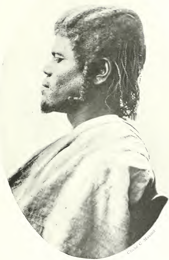
FIG. 1. - Peul du Bakhounou, porteur de tresses.